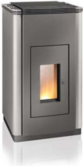
PELLETTO 417.08/3 anthracite/gris fonte Art. Nr.: 0541708030000