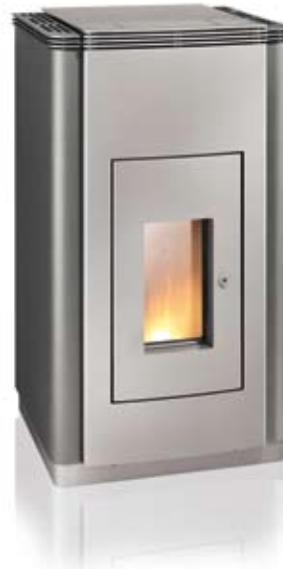
PELLETTO 417.08/4 gris fonte/anthracite Art. Nr.: 0541708040000